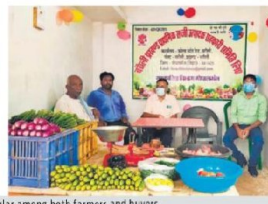
Various outlets selling vegetables under the 'Tarkari' scheme in Bihar. They have become quite popular among both farmers and buyers